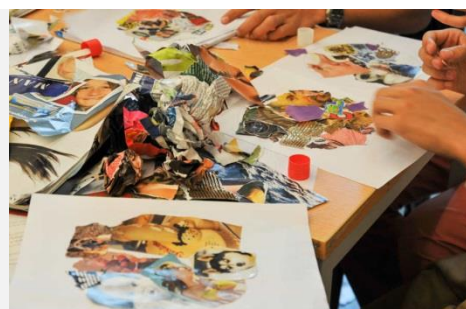
Atelier « journée des arts » au Collège de Gembloux

Formule 2 : animation d'un atelier d'écriture ou de parole sur l'estime de soi à partir de la création d'un mandala en papier déchiré pour 12 personnes maximum. On peut aussi combiner animation et spectacle.